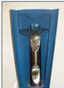
Cena pre našich hieromučeníkov