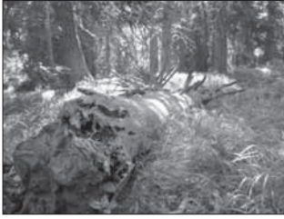
pokornejšími, pretože skromnosť a pokora je to, čo mnohým z nás chýba.

Ak budeme spolupracovať s prírodou, tak určite. Som optimistom a dúfam, že vietor, ktorý nad Tatrami zavial, je vetrom, ktorý nám všetkým pomôže byť skromnejšími a