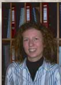
Najprv Boh a potom všetko ostatné

„Kúp“ si svoj strom - a nielen v Tatrách