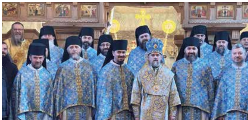
Свято-Успенська Унівська Лавра