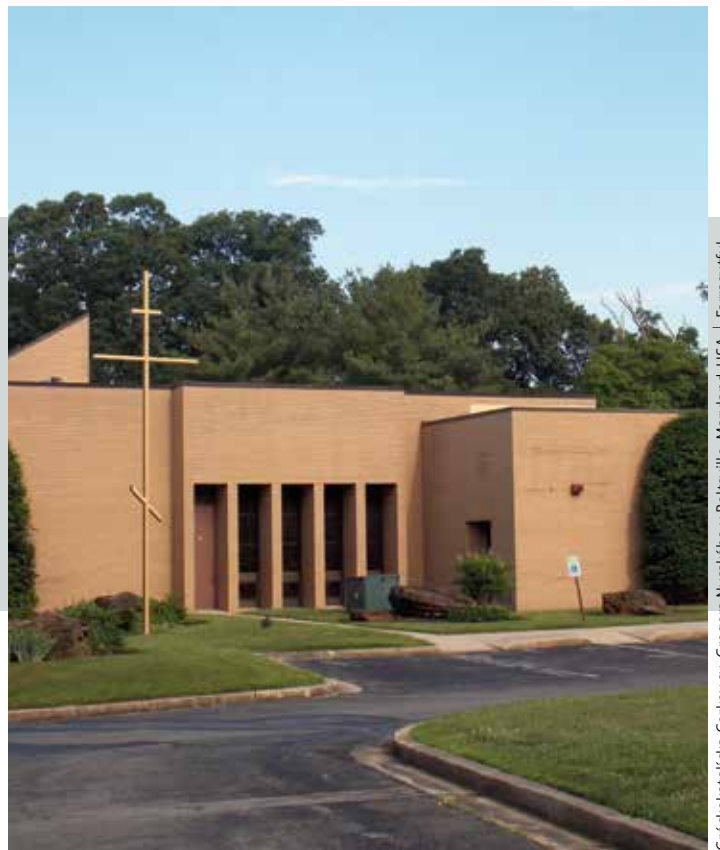
Gréckokatolícka Cirkev sv. Gregora Nysského v Beltsville, Maryland, USA

Vykonám analýzu založenú na Písme a vlastnom výskume, aby som mohol zoradiť históriu (ľudskej prirodzenosti) v správnom poradí medzi týmito protikladmi, ktoré sa nakoniec aj tak skončia rovnako, pretože Božia moc dáva nádej proti nádeji a nachádza východisko z nemožných situácií. (preložil a upravil Miroslav Dancák)