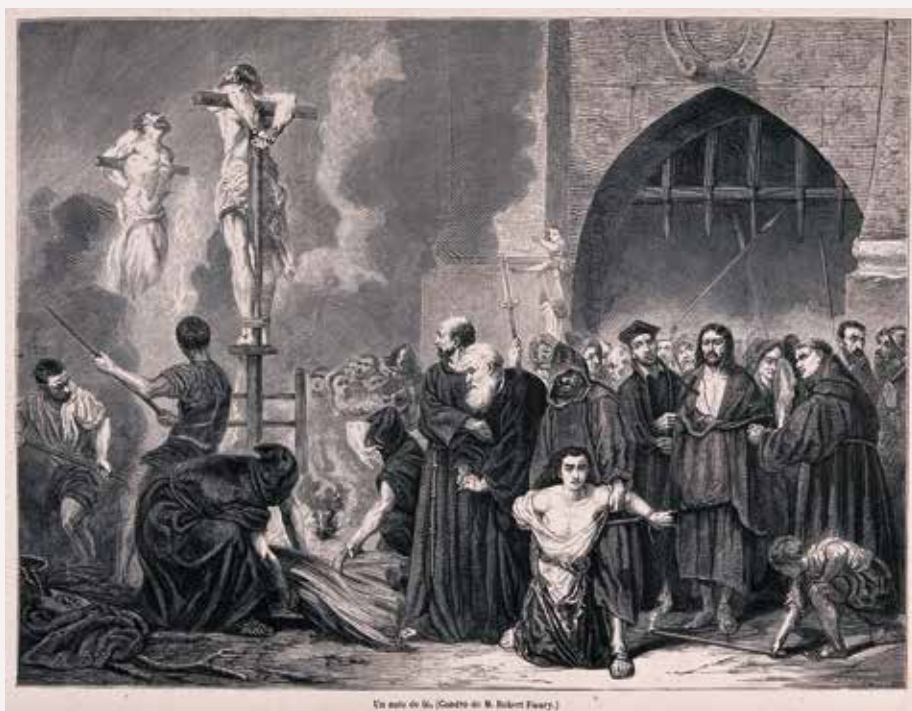
Spanielska inkvizícia | wellcomecollection.org

kresťanov, používanie násilia v službe pravde, židovsko-kresťanské vzťahy a tieň zla v dnešnej spoločnosti. Na záver tejto úvahy komisia považovala za potrebné ešte raz zdôrazniť, že Cirkev sa vo všetkých formách pokánia za viny minulosti a v každom s nimi spojenom geste obracia predovšetkým k Bohu s úmyslom osláviť ho a osláviť jeho milosrdenstvo, veriac v to, že pravda človeka oslobodí.