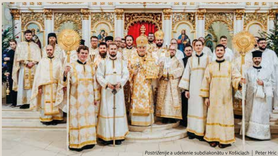
Postríženije a udelenie subdiakonátu v Košiciach