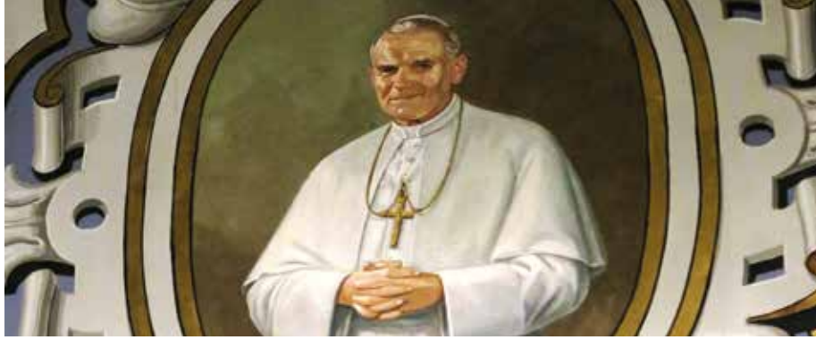
Portrét sv. Jána Pavla II. v Seville