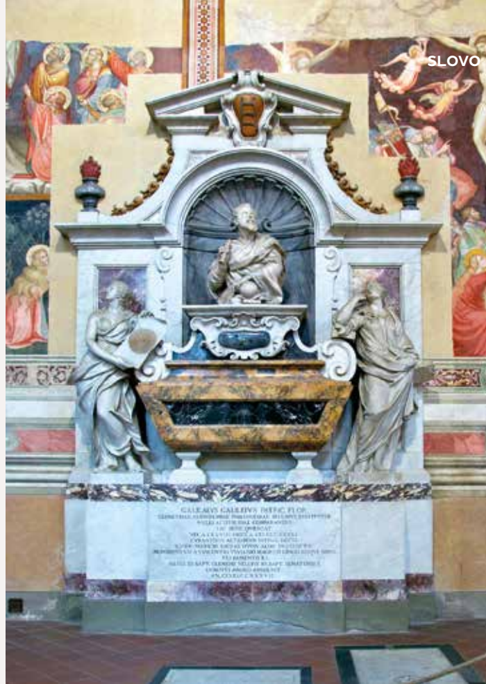
Hrobka Galileia Galileiho v bazilike vo Florencii

Celý proces očisťovania pamäti si vyžaduje správnu kombináciu historického hodnotenia a teologického pohľadu, a preto ho deti Cirkvi majú prežívať nielen s prísnosťou, ktorá presne dodržiava stanovené normy a zásady, ale aj v atmosfére neustáleho vzývania Ducha Svätého o pomoc, aby neupadli do nepriateľstva alebo sebaľútosti, ale aby dospeli k vyznaniu Bohu, ktorého milosrdenstvo prechádza z pokolenia na pokolenie. V piatej kapitole sa dotkol tém ako rozdelenie