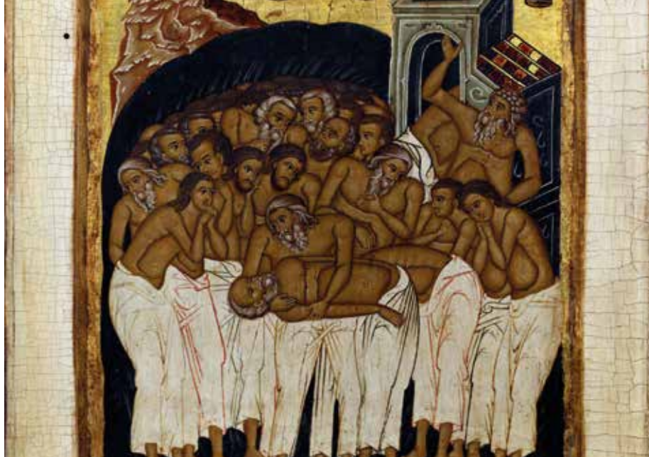
Stýridsať mučeníkov, ruská ikona, 1850 – 1899

bratov, a sestry. Aká veľká veľkodušnosť je cesta kresťanského svedectva!