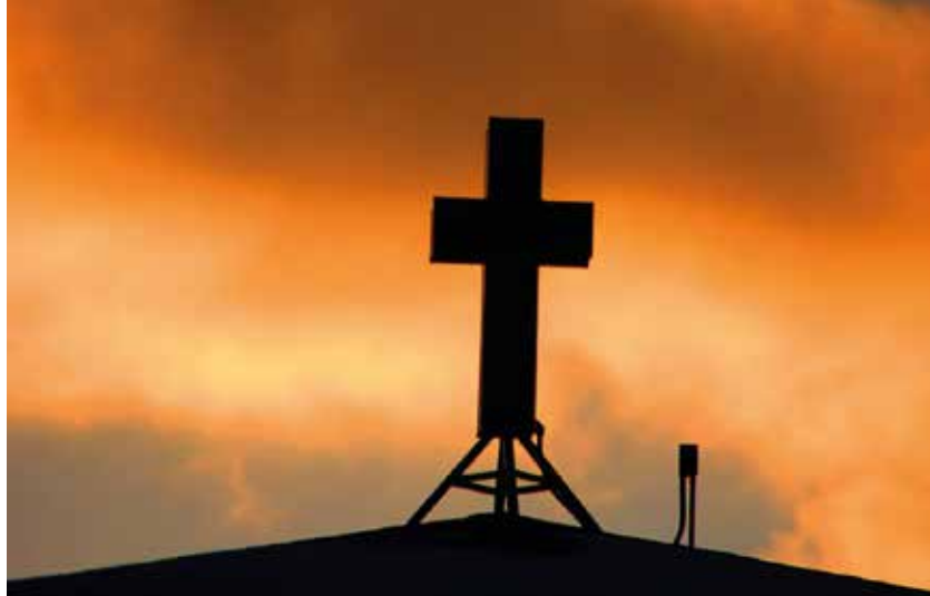
Križ na pozadí „horiaceho“ západu slnka