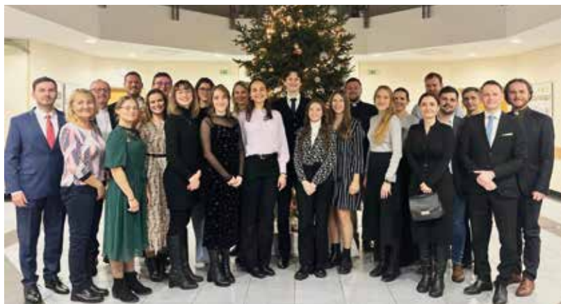
Spolok sv. Cyrila a Metoda